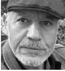
Par Abderrahman El Fouladi

V ous l'aviez sans doute remarqué : Depuis le début de 2020, la forêt des problèmes climatiques a tout-à-coup disparu,