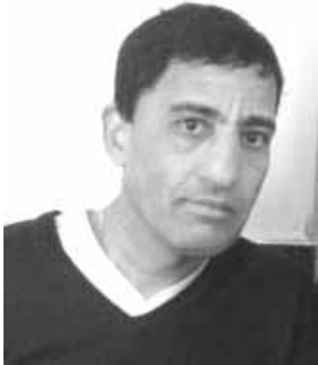
Par Mustapha Bouhaddar

Un naufrage qui a provoqué 27 morts, le centre opérationnel de surveillance et de sauvetage (Cross) Gris-Nez n'a eu connaissance de la situation que lors de l'appel passé par un pêcheur en milieu de journée », écrit la préfecture maritime de la Manche et de la mer du Nord. « Tous les appels reçus par le Cross » qui pilote les sauvetages dans la zone « sont pris en compte et traités, quel que soit le secteur maritime, les gens sont secourus. Un renvoi de responsabilité entre centres de sauvetage en mer n'est pas réaliste », a-t-elle insisté. Et la préfecture de souligner « que tous les appels vers les centres de secours sont enregistrés ».