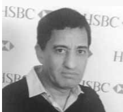
Par Mustapha Bouhaddar

L'Édition du Printemps des poètes de 2023 en France se déroule du 11 au 27 Mars sous le thème «Frontières».