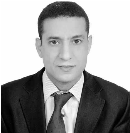
Par Abdel-Jalil Zaidane , Tétouan (Maroc)

A u XIX siècle, il aurait été inconcevable de considérer une femme, un "indigène", un enfant, voire une personne handicapée comme un être humain égal en droit à l'homme.