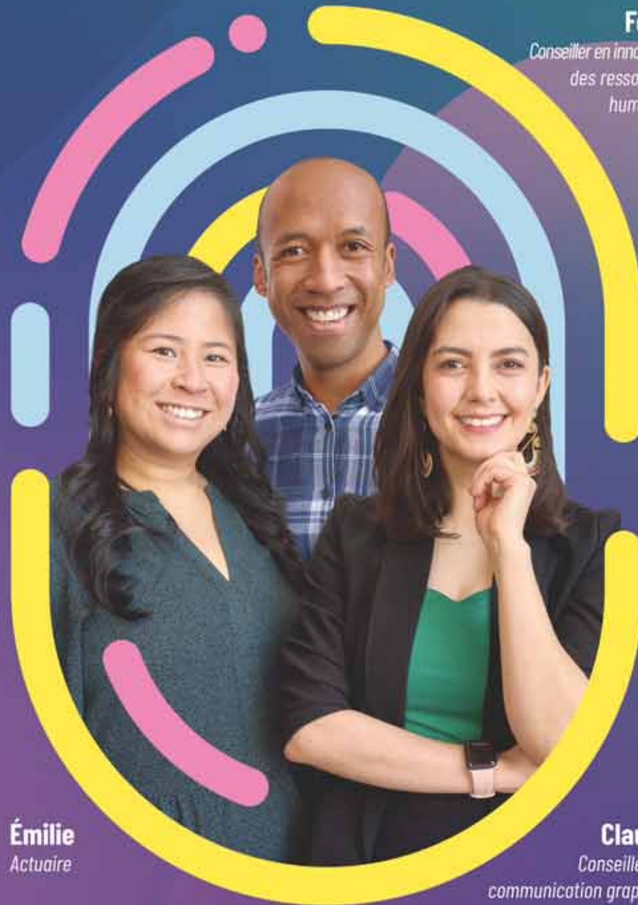
Fetra Conseiller en innovation des ressources humaines